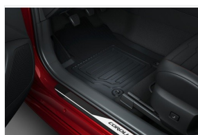
Dywaniki gumowe kpl

Polecane akcesoria niewliczone do powyższej kalkulacji