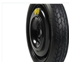
Koło dojazdowe COROLLA TS